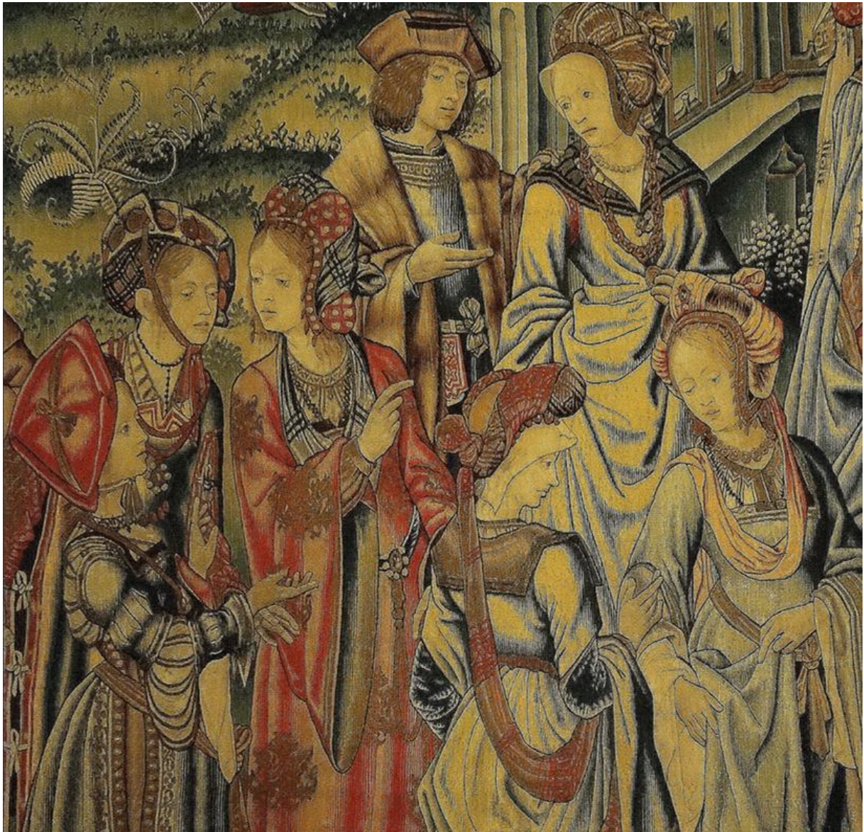
Tapisseries David & Betsabee (détail: Toilettes Féminines), Musée national de la Renaissance

Kort geleden zijn de eerste en tweede verdieping gerestaureerd. De zeer beroemde wandkleden met als onderwerp het verhaal van David en Batsaba hangen nu weer in volle glorie in de prachtige ruimten op de eerste verdieping. Op de tweede verdieping zijn glaswerk, edelsmeedwerk, aardewerk en Franse tegels te zien. Ook is er een serie gebrandschilderde ramen met religieuze onderwerpen.