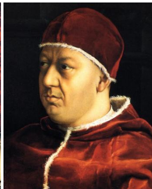
paus Leo X